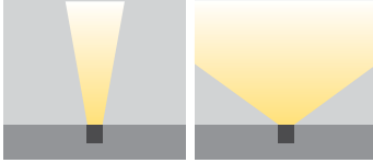
N: Dar Açılı