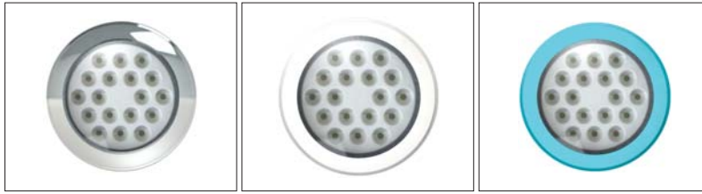
15: Krom kaplı 16: Beyaz 19: Turkuaz