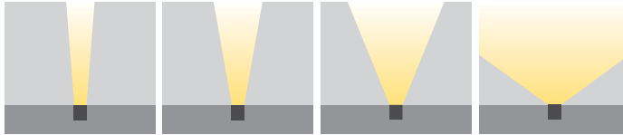
XN: Ekstra Dar Açılı N: Dar Açılı M: Orta Açılı XW: Lensiz