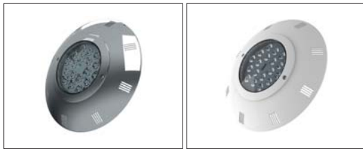
15: Krom kaplama