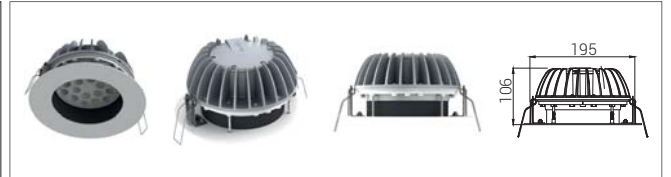
10: Derin Sabit*