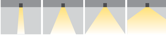
XN: Ekstra Dar Açılı