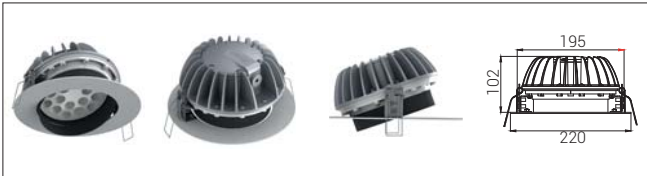
11: Derin Hareketli*