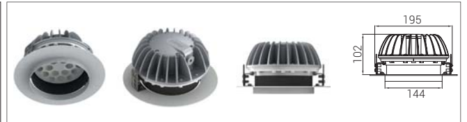
12: Derin Gömme Hareketli*