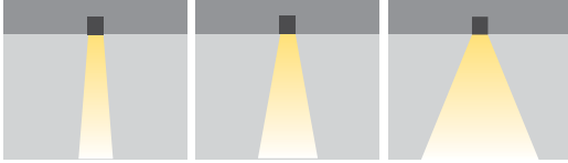
XN: Ekstra Dar Açılı N: Dar Açılı M: Orta Açılı