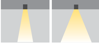
N: Dar Açılı