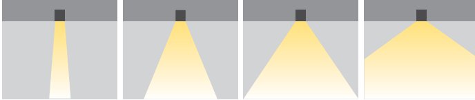
XN: Ekstra Dar Açılı