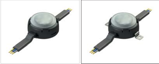
01: Sıva üstü yapıştırma