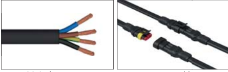
01: Kablolu *