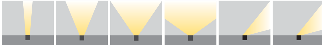
XN: Ekstra Dar Açılı