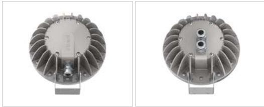
09: Ayak altından tek giriş