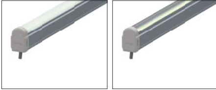
D: Difüze Kapak