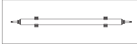
03: Soldan ve sağ dan giriş